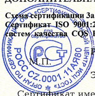
Схема сертификации За. Маркировка продукции знаком соответствия по ГОСТ Р 50460-92 – на упаковке. Сертификат ISO 9001:2001 № CQS 2139/2007 от 26.04.2007, выданный органом по сертификации систем качества CQS Praha Чешская Республика.